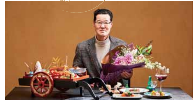
長寿の祝(喜寿・米寿・白寿)